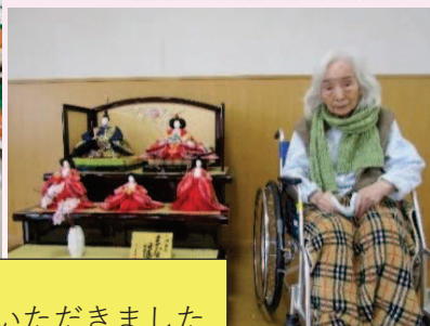
おいしくいただきました