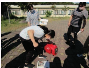
随時職場内研修を実施しております