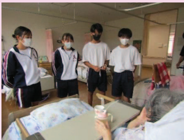
課題解決型職場体験の様子